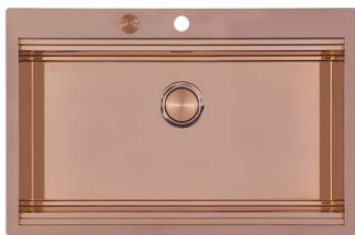
Fregadero Milanello Copper workstation 1034 058